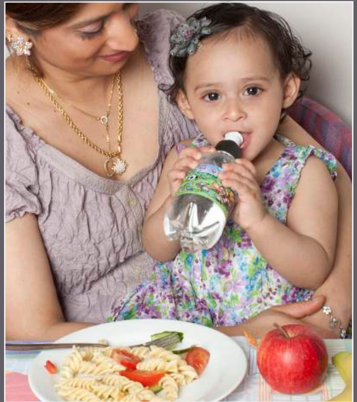
تغذیه مناسب در اوقات غذا خوردن مشخص

یک زمین خوردن یا اثابت ضربه ای بر دهان میتواند به یک یا تعدادی از دندانها آسیب برساند. با نزدیکترین کلینیک دندانپزشکی تماس بگیرید.