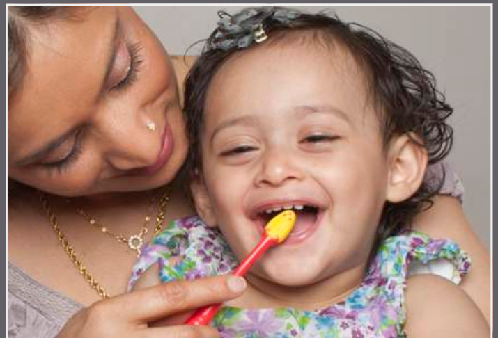
مسواک زدن و فلوراید.....شب و روز